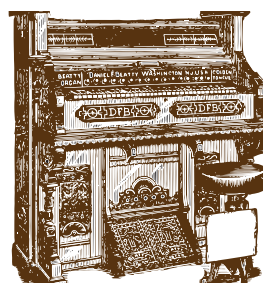
6. HARMOONI *G