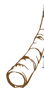
1. TUOHITORVI *I