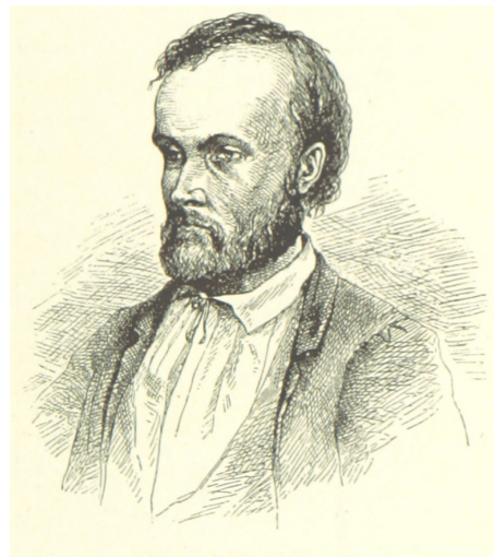
ALEKSIS KIVI (1843–1872)