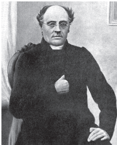
JOHAN LUDVIG RUNEBERG (1804–1877)